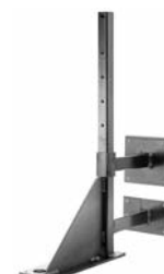
Zembord WD Winkel Équerre-Zembord WD