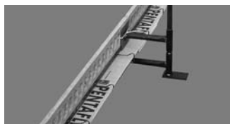
Zembord WD-P für Pentaflex Zembord WD-P pour Pentaflex