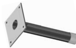
Edelstahlgleithülse Gaine de coulisement en inox