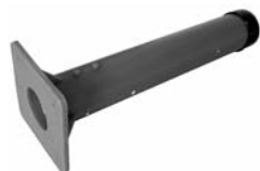
Kunststoffgleithülse Gaine de coulisement en plastique