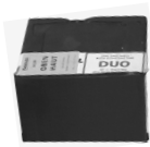
Schall-Isobox Schall-Isobox DUO*