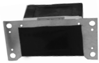
Schall-Isobox Standard Schall-Isobox DUO*