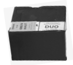
Schall-Isobox Schall-Isobox DUO*