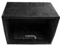
Typ/Type TSB-F Schall-Isobox/Boîte insonorisante