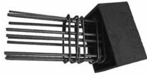
Typ/Type TSB-T Schall-Isobox/Boîte insonorisante Füllkörper/Remplissage Armierungskorb/Corbeille d'armature