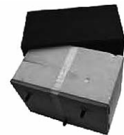
Typ/Type TSB-MB Schall-Isobox/Boîte insonorisante Füllkörper/Remplissage