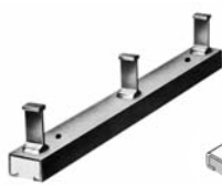
Ankerschiene JTA Rails d'ancrage JTA

Désignation exacte selon JORDAHL H-BAU-Docu (Internet)