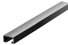
Montageschiene JM Rails de montage JM