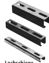
Lochschiene Rails perforés