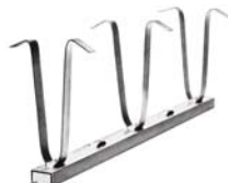
Ankerschiene JSA Rails d'ancrage JSA